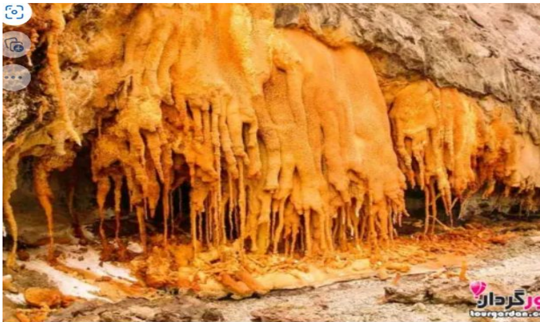
غار خرسین نزدیک به بندرعباس استان هرمزگان

حدود سی درصد از صادرات نفت جهان از این راه انجام می شود. از جاهای دیدنی استان هرمزگان می توان جزیره ها معابد موزه ها و غار ها و دره ها و بسیاری دیگر را نام برد.