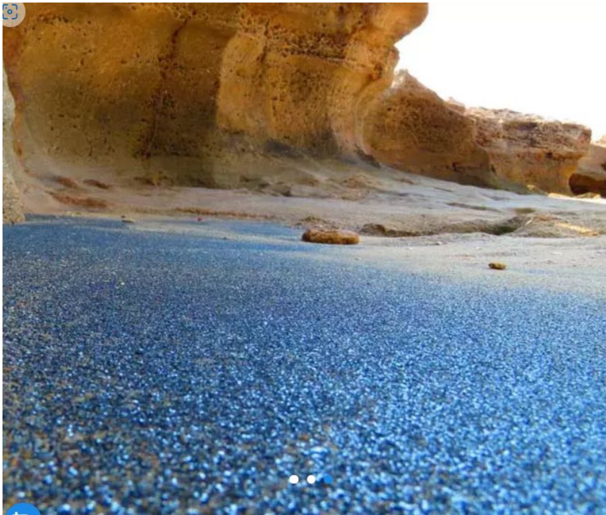
ساحل نقره ای قشم